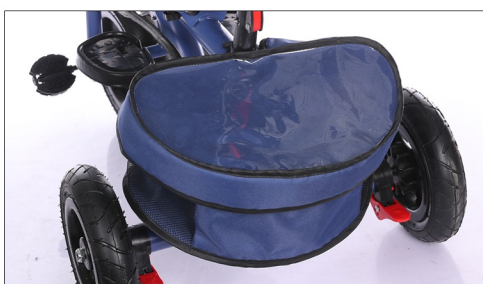
Postavite poklopac preko korpice.