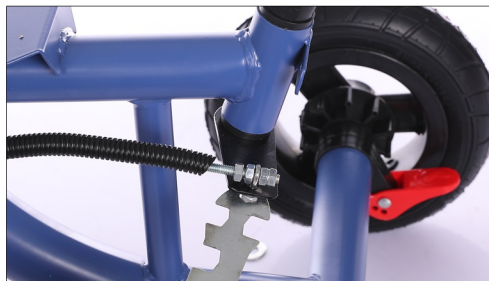
Postavite zadnji deo upravjacke poluge na donji deo upravljaca.