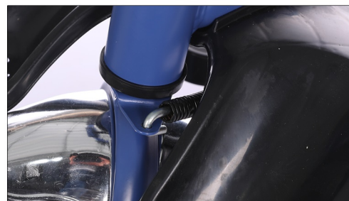
Postavite prednji deo upravjacke poluge na viljusk.