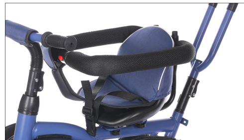
Postavite zastitnu ogradicu.