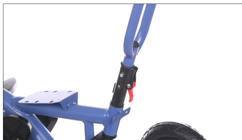
Postavite upravljac i zategnite ga.