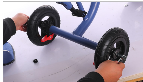
Postavite tockove i zategnite ih.