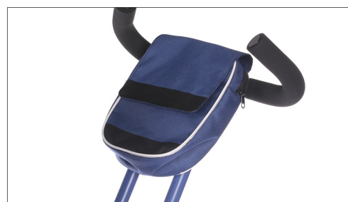
Postavite torbicu na gordji deo upravljaca.