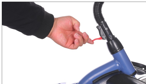
Zategnite ga pomocu stege.