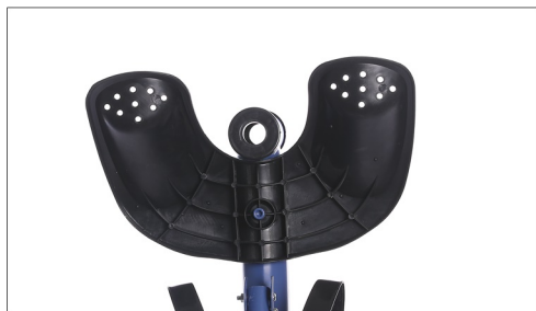
Postavite drzac za noge na ram.