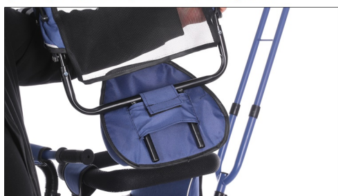
Postavite naslon za ledja.