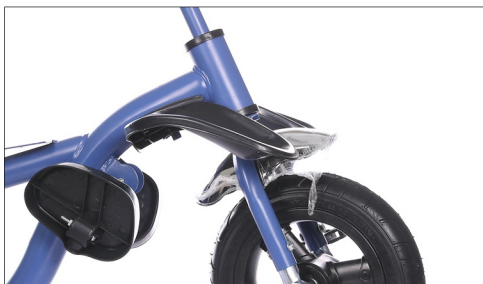
Postavite prednji tocak na ram.